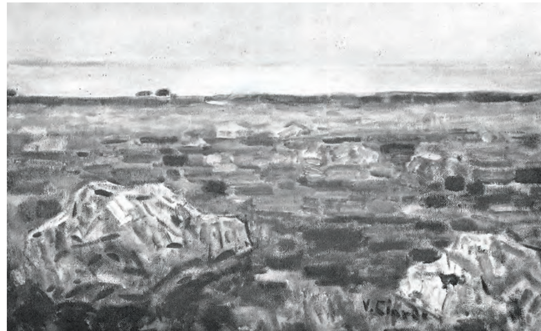
Fig. 6 – Vincenzo Ciardo, Cielo mare e sassi , dal catalogo XXIV Biennale Nazionale d'arte Città di Milano , 1965, ill. p. 67.

Alla Biennale successiva, tenutasi nel 1957, Ciardo propone Note primaverili , che potrebbe essere lo stesso dipinto scelto inizialmente dal Comune di Milano e poi restituitogli. La tela viene acquistata per 200.000 lire dalla