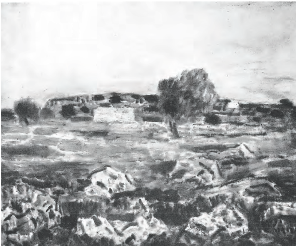
Fig. 7 – Vincenzo Ciardo, Paesaggio salentino , dal catalogo XXV Biennale Nazionale d'arte Città di Milano , 1967, ill. p. 31.

Tra gli invitati d'onore, oltre a Ciardo,