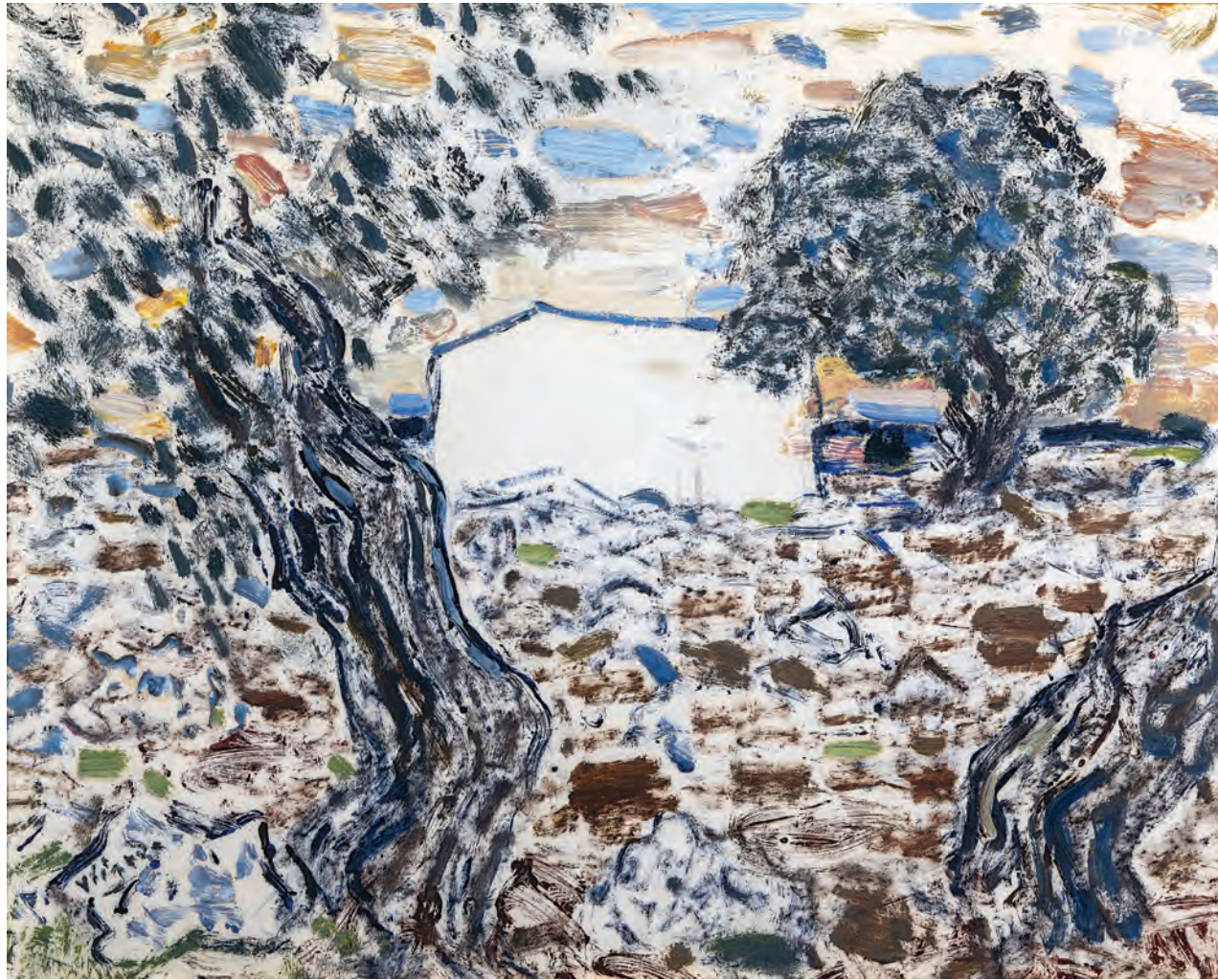
Fig. 1 – Vincenzo Ciardo, Casa ed ulivi , Olio su cartoncino, 47 x 59 cm, collezione privata, provenienza Galleria Ettore Gian Ferrari, Milano.