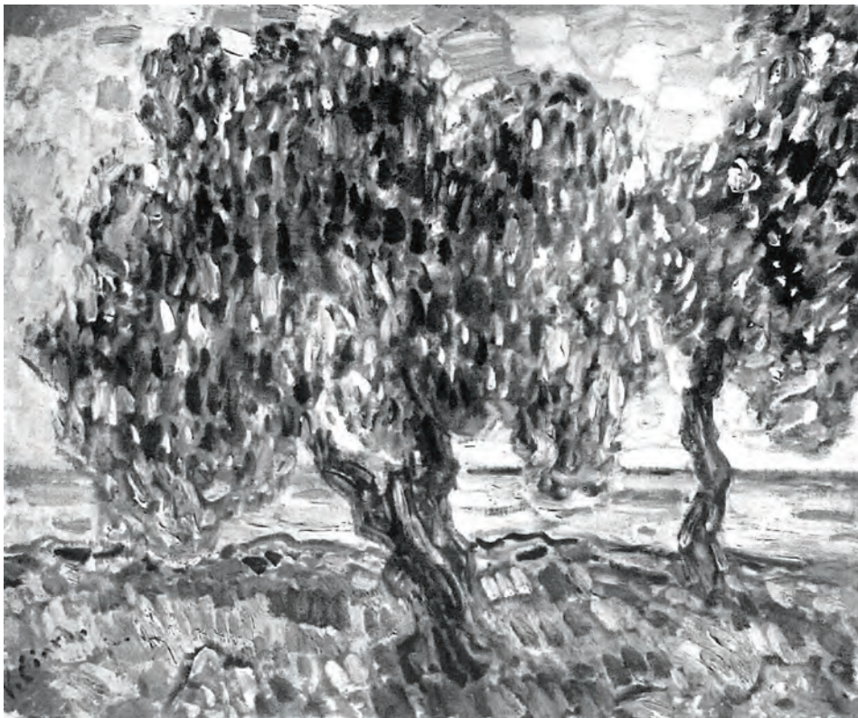
Fig. 5 – Vincenzo Ciardo, Ulivi , dal catalogo Pittura italiana contemporanea , 1960, opera n. 2.

stringe un rapporto sempre più cordiale con Remo Taccani, a cui, passati oltre due mesi dalla chiusura della mostra, scrive da Napoli: