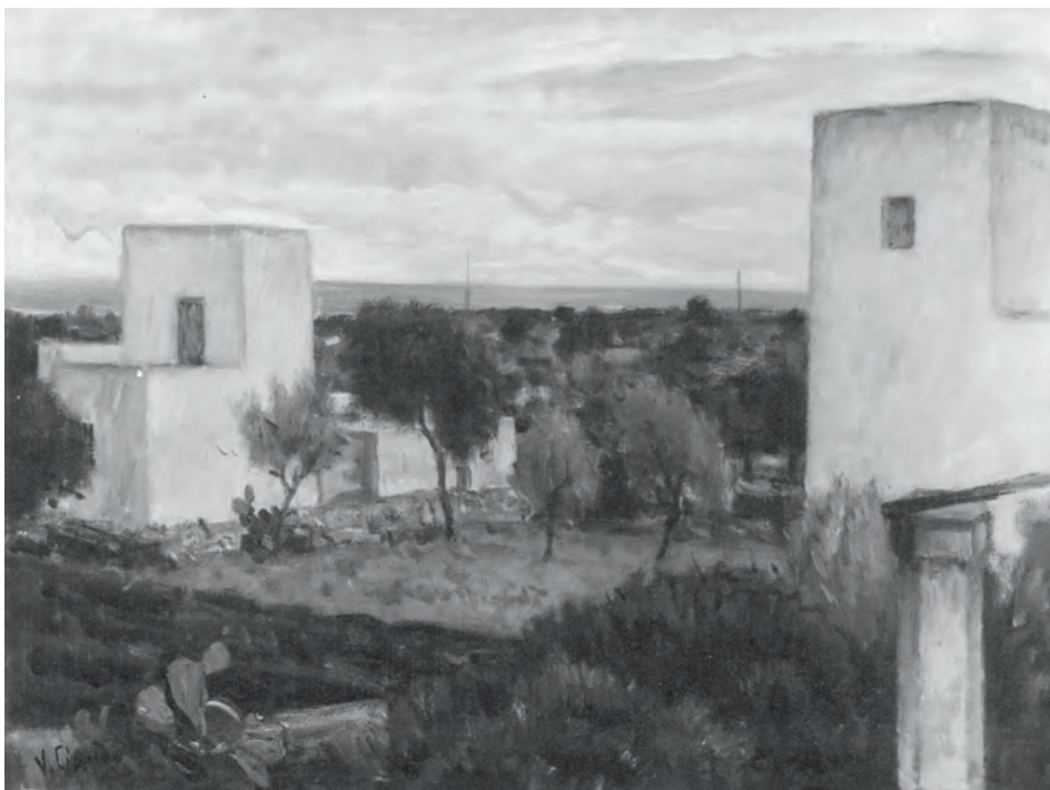
Fig. 1 – Vincenzo Ciardo, Torregaveta (da CASSIANO 1979, p.50.)