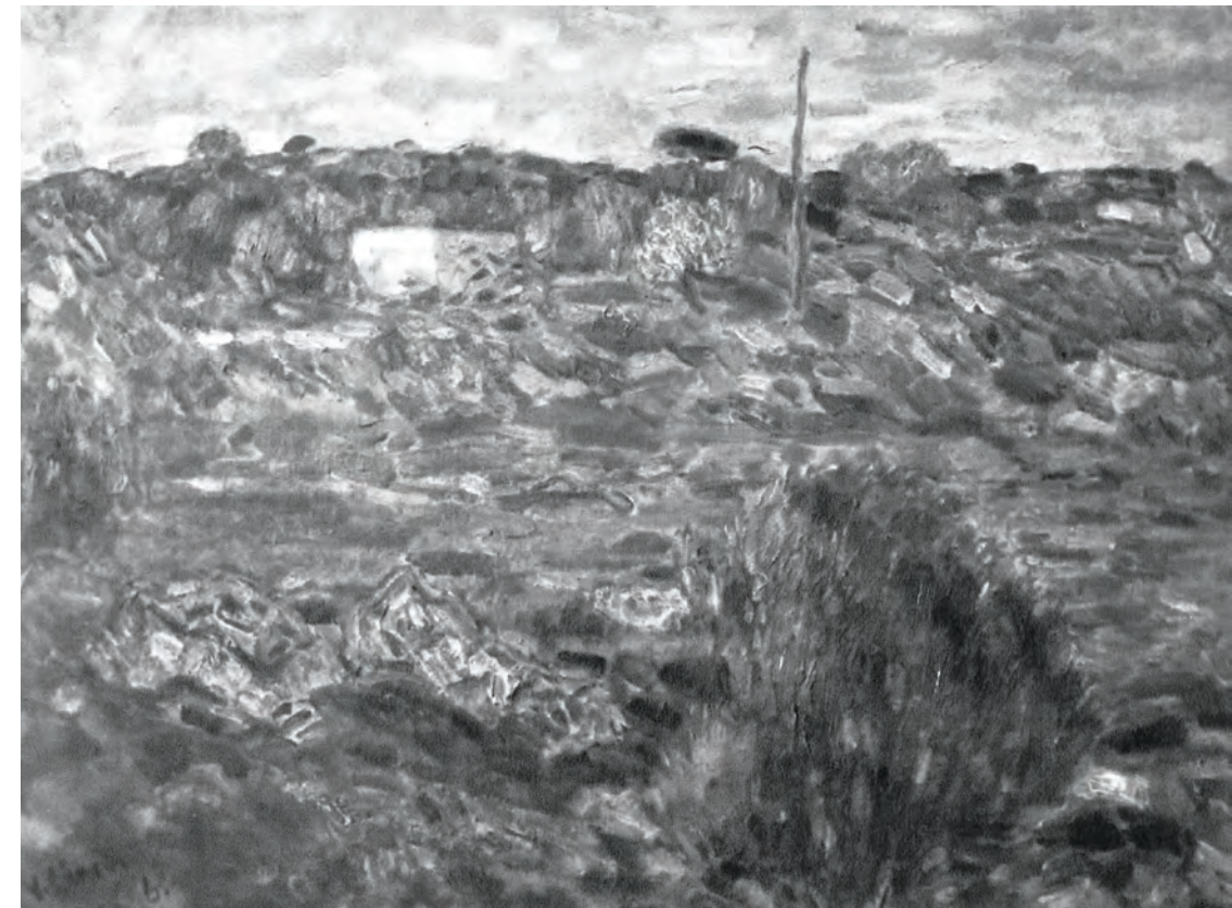
Fig. 8 – Vincenzo Ciardo, Terra del Salento , olio su tela, 75 x 90 cm, dal catalogo La tavolozza figurativa. Mostra d'arte contemporanea , 1968, ill. p. 45.