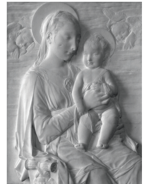
Fig. 2 – Antonio Rossellino, Madonna col Bambino , rilievo in marmo, 67x52, 1560-70, San Pietroburgo, Museo dell’Ermitage.

Nel ripercorrere la sua carriera, si può individuare una linea di continuità, un filone che non pretende di esaurire le valenze di una produzione più ampia e variegata, soprattutto nei primi decenni della sua attività. Rimando agli altri interventi su Ciardo contenuti in questo volume per una messa a fuoco della posizione di Ciardo nel panorama artistico e critico del Novecento e mi limito a considerare la dialettica tra il suo percorso stilistico e il paesaggio nativo. Ritengo che Ciardo abbia colto alcuni aspetti peculiari dell’ambiente del basso Salento, o estremo Salento come