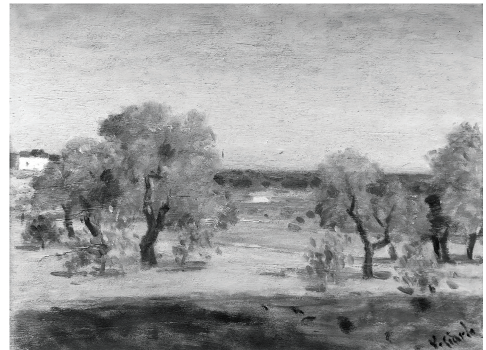
Fig. 7 – Vincenzo Ciardo, Tramonto a Gagliano del Capo , Roma, Galleria Nazionale di Arte Moderna.