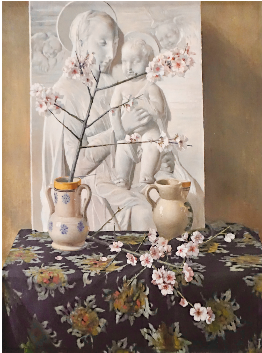
Fig. 1 – Vincenzo Ciardo, Natura morta con Madonna e fiori di mandorlo , 1921 ca. olio su tela, 100x75 Gagliano del Capo, Convento di San Francesco di Paola. (foto Filulab).