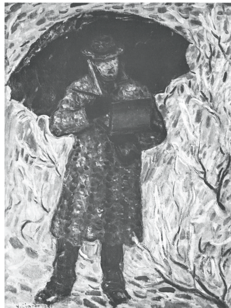
Fig. 8 – Vincenzo Ciardo, Autoritratto con l'ombrello , Napoli, Museo e Real Bosco di Capodimonte.

Il paesaggio di Ciardo è emblematico. Si tratta di un paesaggio apparentemente privo di presenza umana, e tuttavia densamente abitato da essa in forma indiretta. Le visioni di Gagliano del Capo e di Santa Maria di Leuca che egli dipinge sono uno spazio plasmato nei secoli dal lavoro dell'uomo: arature, coltivazioni, uliveti disegnano una geografia addomesticata, in cui la natura e la cultura si fondono. Nei suoi quadri compaiono pali elettrici, segni della modernità e della comunicazione (tav. 10), oppure le tipiche case rurali bianche e le pagliare costruite a secco, testimonianze di una civiltà contadina antica e resistente (fig. 7). L'uomo non è visibile, ma è ovunque implicito 41 .