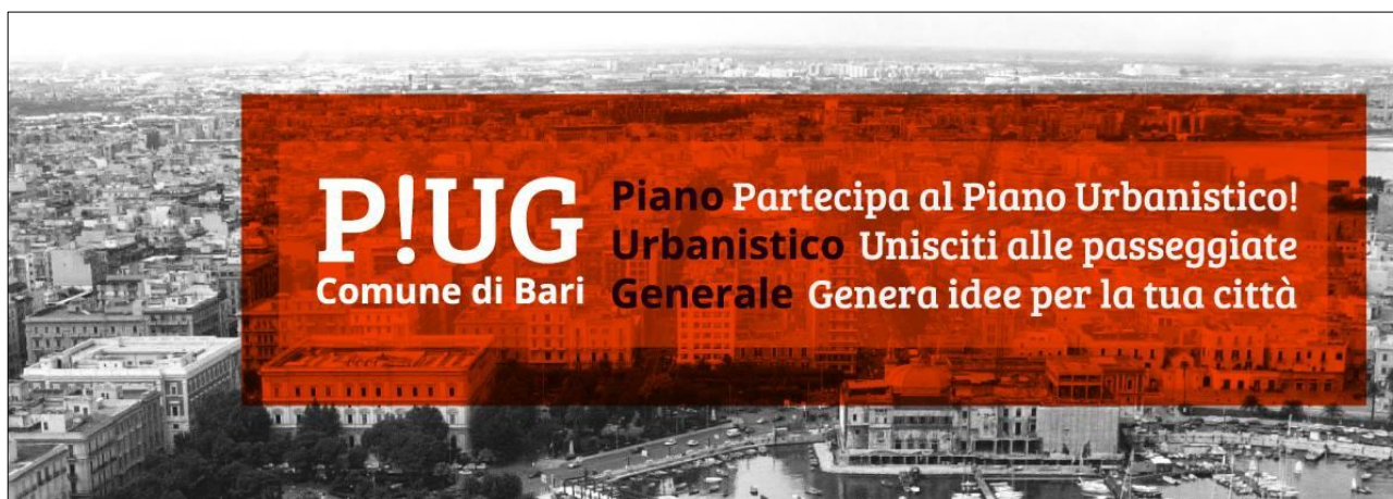
Fig. 1 - L'acronimo di PUG Bari.

Ai cittadini si chiede di intervenire su tre Assi principali: Spazio pubblico, Paesaggio e Mobilità (Cluster) (Tab. I). A tal proposito sono stati utilizzati due strumenti integrati. Il primo consiste nella compilazione di schede online impostate sulle seguenti domande: Il tuo quartiere, visto con i tuoi occhi: Quali difetti? Quali pregi? Quali idee per il suo futuro? Interpretare il territorio attraverso poche semplici domande. Il secondo strumento è una Mappa relativa al Municipio di appartenenza con le seguenti domande: Quali sono i luoghi significativi del tuo quartiere? Perché lo sono? Lasciare una segnalazione, orientandosi attraverso la mappa, con il supporto della scheda e contribuendo alla valorizzazione del territorio con proposte e spunti di riflessione (Fig. 2).