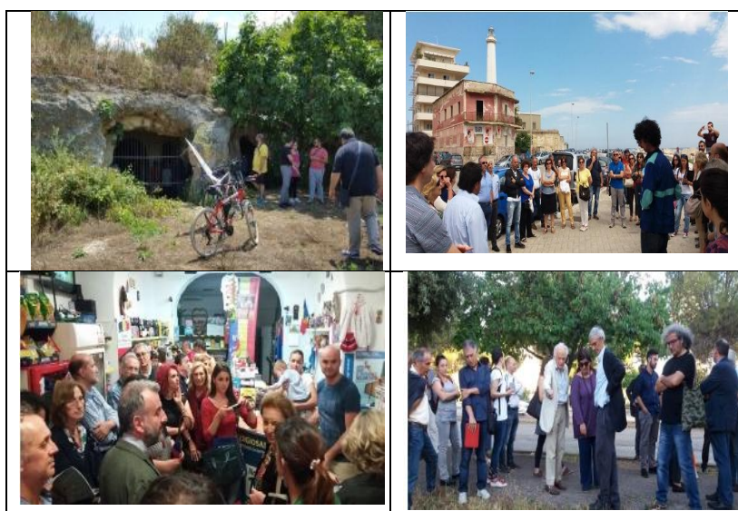
Fig. 3: Le passeggiate urbane esplorative.

Le passeggiate visualizzate rappresentano una selezione e riguardano in ordine orario i percorsi 1, 2, 3, 4 (Fig. 3).