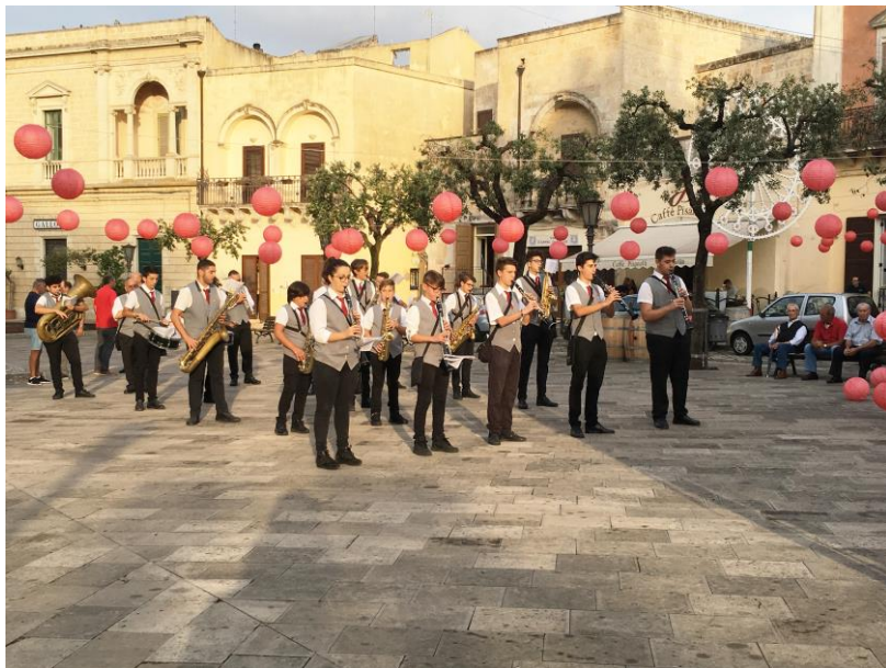
fig. 4 - Banda "Filarmonica del Capo di Leuca". Piazza Pisanelli. Festa della Madonna del Loreto. 8/09/2017

Tricase, e viceversa. Naturalmente la banda accompagna la processione.