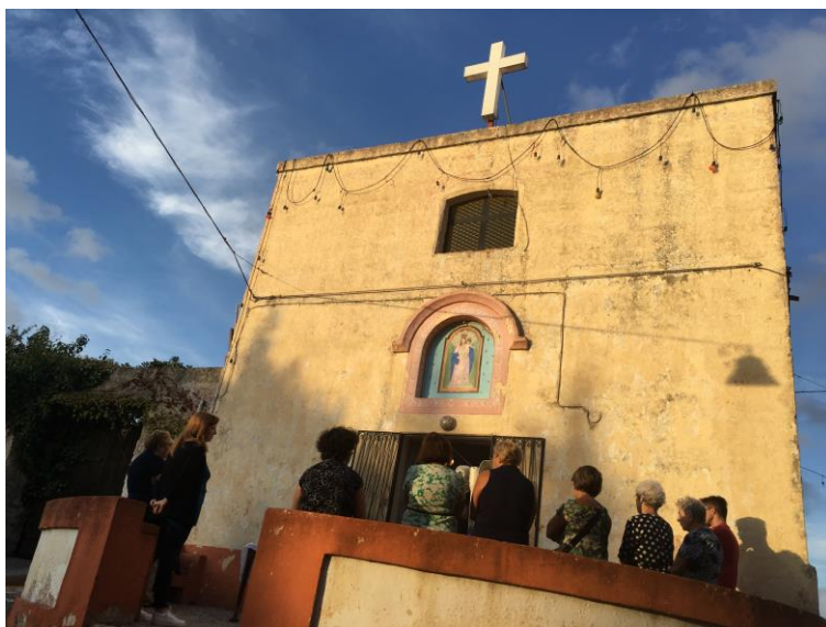
fig. 3 - Messa della Madonna del Loreto. Tricase. 7/09/2017

bestiame. Ancora oggi l'8 settembre si festeggia la Madonna, ma della fiera non si scorge nulla se non una baracca di noccioline.