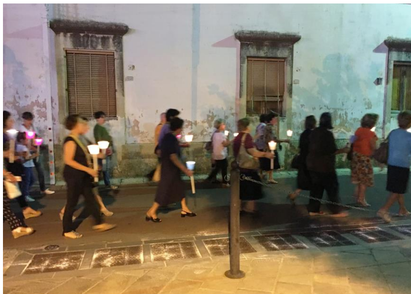
fig. 5 - Rito della fiaccolata. Centro storico di Andrano. 6/08/2017

Un'altra festa religiosa, ancora presente, legata all'area del Mito è la Festa della Madonna dell'Attarico che si svolge ad Andrano la domenica antecedente la Festa della Madonna delle Grazie.