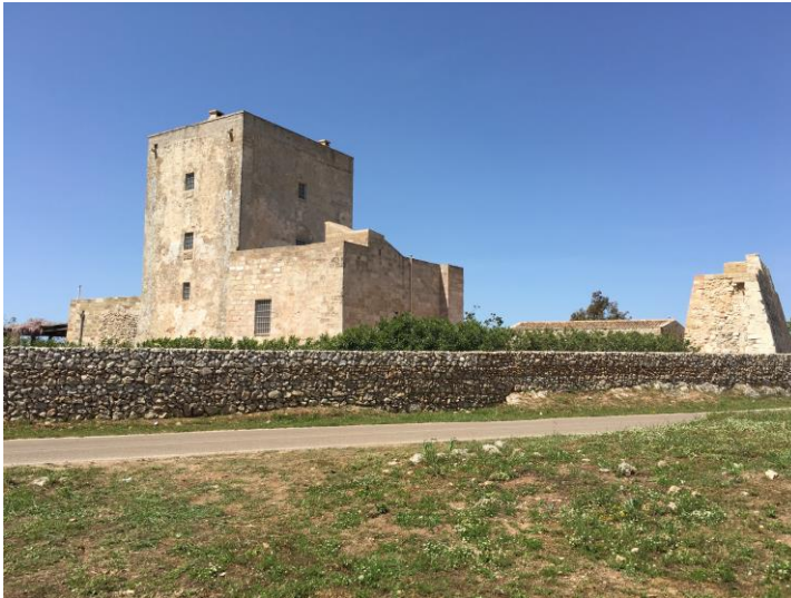
fig. 2 - Abbazia del Mito. Tricase. Archivio “LiquiMag – Magazzino delle memorie”. 17/04/2016

perché ibi semper erat Statio Militum» (Tasselli 1693: 590): da questa frase latina sembrerebbe che la terra del Mito sia chiamata così per la presenza di una “stazione militare”; alla migrazione dei calogeri in fuga dalla Grecia sulle coste salentine, in seguito alle disposizioni iconoclaste dell’imperatore Leone III Isaurico, è attribuita la realizzazione di un monastero, meglio conosciuto come Abbazia di Santa Maria del Mito (Cassati 1978, Accogli 2004, Pantaleo 1980); da qui anche la presenza di cripte e laure con affreschi di madonne, tra cui la cripta della Madonna dell’Attarico, sita a poca distanza dall’Abbazia del Mito. Dopo questa prima fase di eremitismo da parte dei monaci, presto si iniziarono a creare degli agglomerati rurali nell’entroterra, sì da costruire dei veri e propri complessi monasteriali.