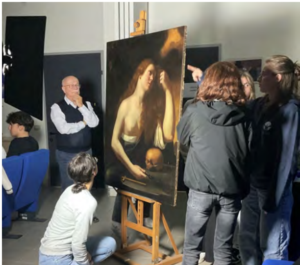
Figura 1: Lezione di Archeometria a Ferrara. https://www.facebook.com/artandscienceacrossitaly/posts/

stessa. Questa prospettiva va oltre il campo delle arti visive e si concentra sull'esplorazione di ogni forma d'arte come mezzo per comprendere e rappresentare aspetti della realtà che sono altrimenti invisibili e che costituiscono l'oggetto della ricerca scientifica. Obiettivo è avvicinare gli studenti alle scienze stimolando il loro interesse e migliorando le loro competenze attraverso un approccio interdisciplinare alla conoscenza.