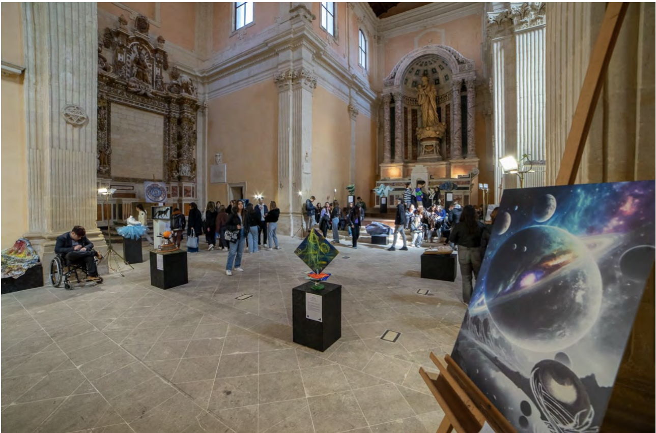
Figura 3: Edizione 2024 di Lecce, allestita nella ex Chiesa di San Francesco della Scarpa.

studenti e istituzioni. Quest'anno, l'interesse per la competizione è cresciuto enormemente, alimentando un nuovo fervore attorno all'iniziativa e aprendo nuove opportunità di crescita e collaborazione per il futuro.