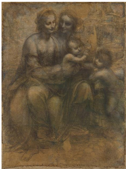
Fig. 12. Leonardo da Vinci, Sant'Anna, la Madonna, Gesù Bambino e san Giovanni , gessetto nero e biacca su carta, cm. 141,5x104. The National Gallery of Art (Londra), n. 6337.