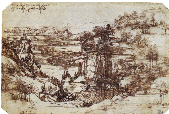
Fig. 4. Leonardo da Vinci, Studio di paesaggio , 1473. Penna e acquerello su carta, mm 194x286. Gabinetto Disegni e Stampe degli Uffizi (Firenze), 8P recto.

dopo però le strade dei due pittori sembrano orientarsi su binari sensibilmente, se non radicalmente diversi, sia professionalmente sia stilisticamente: Perugino individua la città umbra e il suo territorio come ideale trampolino di lancio, mentre Leonardo per tutti gli anni settanta sembra non riuscire a imprimere una chiara direzione alla propria carriera, oscillando tra gli estremi di un perfezionismo frustrante e della tendenza a quello che Kenneth Clark chiamava “doing nothing” 4 . Nel 1473 Perugino partecipa, con la tavola raffigurante il Risanamento della figlia di Giovanni Antonio Petrazio da Rieti , a quel monumento di cultura prospettica che sono le Storie di san Bernardino dipinte per l’omonimo Oratorio di Perugia, e ora conservate nella locale Pinacoteca Nazionale; nello stesso anno, “adì 23 daghossto 1473 dì di sancta Maria della neve”, Leonardo traccia su carta il famoso disegno della Valle dell’Arno (Gabinetto Disegni e Stampe degli Uffizi, 8P recto) [Fig. 4].