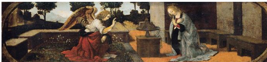
Fig. 3. Lorenzo di Credi, Annunciazione , 1478-85 ca. Tempera su tavola, cm. 16x60. Musée du Louvre, Parigi, 1602.

dopo però le strade dei due pittori sembrano orientarsi su binari sensibilmente, se non radicalmente diversi, sia professionalmente sia stilisticamente: Perugino individua la città umbra e il suo territorio come ideale trampolino di lancio, mentre Leonardo per tutti gli anni settanta sembra non riuscire a imprimere una chiara direzione alla propria carriera, oscillando tra gli estremi di un perfezionismo frustrante e della tendenza a quello che Kenneth Clark chiamava “doing nothing” 4 . Nel 1473 Perugino partecipa, con la tavola raffigurante il Risanamento della figlia di Giovanni Antonio Petrazio da Rieti , a quel monumento di cultura prospettica che sono le Storie di san Bernardino dipinte per l’omonimo Oratorio di Perugia, e ora conservate nella locale Pinacoteca Nazionale; nello stesso anno, “adì 23 daghossto 1473 dì di sancta Maria della neve”, Leonardo traccia su carta il famoso disegno della Valle dell’Arno (Gabinetto Disegni e Stampe degli Uffizi, 8P recto) [Fig. 4].