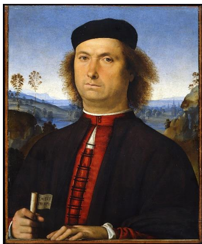
Fig. 15. Pietro Perugino, Ritratto di Francesco Delle Opere , 1494. Olio su tavola, cm. 52x44. Galleria degli Uffizi (Firenze), inv. 1890 n. 1700.

Ma lo errore di costoro dimostrarono poi chiaramente le opere di Lionardo da Vinci, il quale, dando principio a quella terza maniera che noi vogliamo chiamare la moderna, oltre la gagliardezza e bravezza del disegno, et oltre il contraffare sottilissimamente tutte le minuzie della natura così appunto come elle sono, con buona regola, migliore ordine, retta misura, disegno perfetto e grazia divina, abbondantissimo di copie e profondissimo di arte, dette veramente alle sue figure il moto et il fiato 23 .