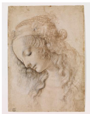
Fig. 2. Leonardo da Vinci, Studio di testa femminile , 1470-1472 ca. Punta metallica, penna, acquerello, biacca su carta, mm 281x299. Gabinetto Disegni e Stampe degli Uffizi (Firenze), 428E.