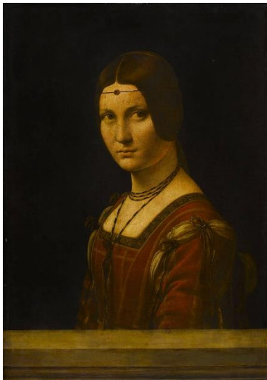
Fig. 9. Leonardo da Vinci, la Belle Ferronnière , ca. 1488-1489. Olio su tavola, cm. 62x44. Musée du Louvre (Parigi), n. 778.

della parete delle Grazie il punto di partenza del Cinquecento e della “maniera moderna”. Ma di certo tale cesura dovette apparire molto meno netta non appena l’opera fu pubblicata, anche se la sua fama si espanse piuttosto rapidamente. Del resto, come già abbiamo detto, il percorso di Leonardo a Milano fu molto meno prolifico e più “privatistico” di quello del Perugino. Così possiamo leggere gli esperimenti sulla tridimensionalità in pittura lungo gli anni Ottanta dalla ancora molto “quattrocentesca” Dama con l’ermellino al ben più maturo dominio dello spazio nel Ritratto di musico e nella Belle Ferronnière [fig. 9], che anche esibisce una più composta ma non meno rigorosa capacità di suggerire il movimento del corpo e dell’animo come fatto esteso nel tempo e nello spazio. Anche la capacità di misurarsi con l’anatomia umana giunge verso la fine degli anni Ottanta a risultati, come il San Gerolamo della