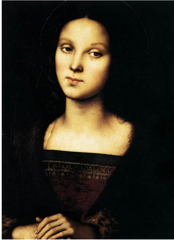
Fig. 14. Pietro Perugino, Maddalena , 1500-1505 ca., Tempera su tavola, cm. 47,2x34,3. Galleria Palatina (Firenze), n. 42.

Ottenuta questa acquisizione vinciana, torniamo al rapporto tra Leonardo e Perugino. L’episodio di Filippino che rinuncia alla commissione a favore di Leonardo (salvo rientrarne – inutilmente – in possesso quando Leonardo è proiettato nell’ancor più ambiziosa impresa della Battaglia di Anghiari ) è una bella dimostrazione di amicizia ma anche un segnale del prestigio che ormai circonda Leonardo allorché si ripresenta, dopo quasi un ventennio di assenza, sulla scena fiorentina: prestigio che non scema nell’anno e mezzo successivo, quando il Vinci è al servizio di Cesare Borgia prima di rientrare a Firenze nel 1503. Che le idee di Leonardo smuovano l’ambiente fiorentino lo dimostra anche Michelangelo, che nella Madonna di Bruges (1502) gli tributa un vero omaggio, curioso in un artista che diventerà il suo rivale per eccellenza. Anche Perugino si affretta a rimodernare in senso leonardesco il proprio bagaglio nella splendida Maddalena di Palazzo Pitti [fig. 14], che non a caso porta una antica attribuzione a