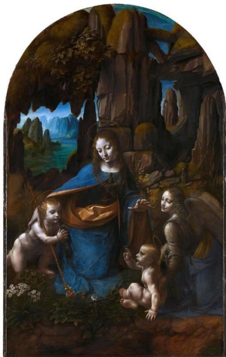
Fig. 10. Leonardo da Vinci, Vergine delle rocce , 1489. Olio su tavola, cm. 189,5x120. The National Gallery of Art (Londra), n. 1093.

Pinacoteca Vaticana e il già citato Musico , che mettono a frutto gli studi anatomici condotti sullo scheletro umano e animale (entro l'inverno 1489) e il confronto, sui temi della crescita dimensionale e dell'illusionismo prospettico, dell'endiadi Bramante-Bramantino 13 . Solo la seconda Vergine delle rocce [fig. 10] aveva però costituito un risultato pubblico, che infatti si pone come punto ineludibile di “modernità” per i pittori lombardi, che ne interpretano chi la delicatezza emotiva (Boltraffio), chi la nuova monumentalità (Bramantino); ma lo stesso Leonardo, indubbiamente, trasse molto in termini di attenzione alla realtà fenomenica e di uso del colore, dai pittori lombardi, Foppa in primis.