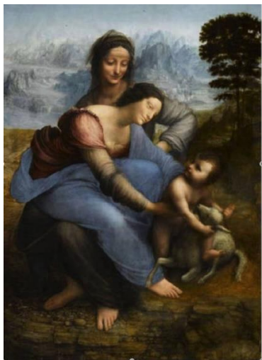
Fig. 11. Leonardo da Vinci, Sant'Anna, la Madonna, Gesù Bambino e un agnello , 1501-1515 ca. Olio su tavola, cm. 168,4x113. Musée du Louvre (Parigi), n. 776.