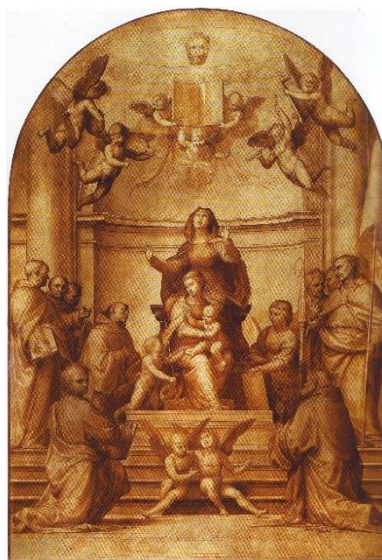
Fig. 13. Baccio della Porta detto Fra' Bartolomeo, Sant'Anna, la Madonna col Bambino e san Giovanni e altri santi (Pala della Signoria) , 1510-1512. Tempera su tavola, cm. 465x308. Museo di San Marco (Firenze), inv. 1890 n. 1574.

sia consistito nel riferire la commissione deposta da Filippino a favore di Leonardo alla pala della Santissima Annunziata invece che alla pala civica per l'altare del Maggior Consiglio: un errore ancora liminale nell'edizione del 1550, e sancito definitivamente nella successiva del 1568. Del resto è evidente il significato politico e filorepubblicano dell'iconografia, con i santi patroni Giovanni e Anna (tale in quanto nel giorno a lei dedicato, 26 giugno 1343, venne cacciato il tiranno Gualtieri di Brienne duca d'Atene e instaurata la Repubblica). Ed ecco quindi la ragione, tutta politica, della processione durata due giorni della cittadinanza fiorentina a vedere il cartone appena uscito dalle mani di Leonardo (non si può escludere che quella di Vasari sia una confusione non del tutto innocente: la Santissima Annunziata era un luogo molto più neutro della Sala del Maggior Consiglio agli occhi di un cortigiano del duca Cosimo I). Ne consegue una importante conseguenza: il cartone di Londra [fig. 12] ci mostra solo il gruppo centrale di una composizione che avrebbe dovuto presentarsi molto più ampia: difficile dire se già Leonardo pensasse a una inquadratura architettonica, come poi farà Fra Bartolomeo nella sua opera, incompiuta, oggi al Museo di San Marco (riprendendo uno spunto già messo a punto da Raffaello nella pala Pitti) [fig. 13] 20 .