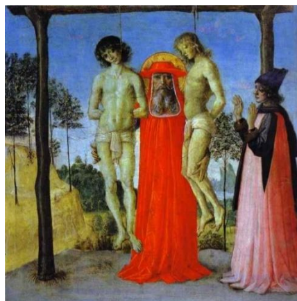
Fig. 1. Pietro Perugino, San Gerolamo scagiona due condannati innocenti , 1470-1473 ca. Olio su tavola, cm. 30,6x28,8, Musée du Louvre (Parigi), M.I. 482.