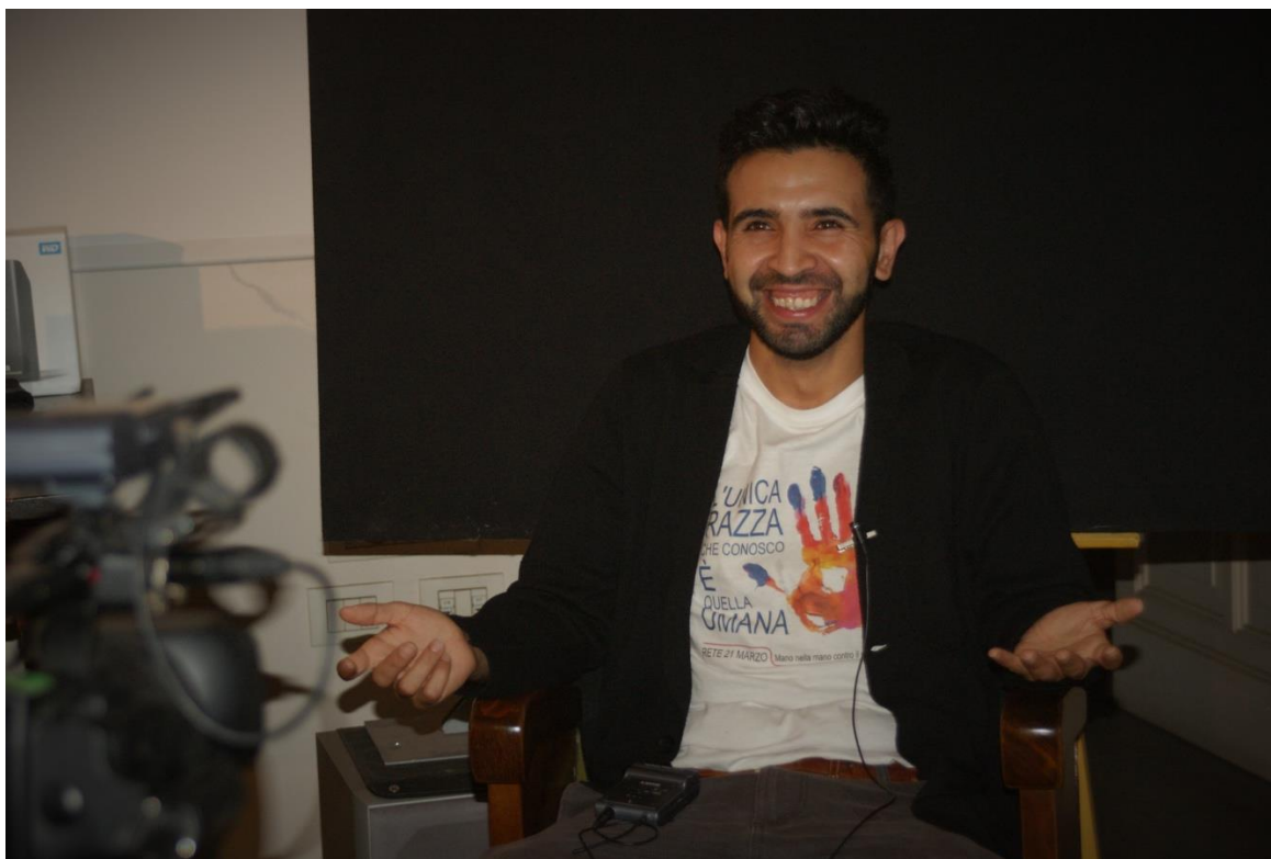
Fig. 3 Riprese di "20 giugno. Giornata mondiale del rifugiato". Torino, Polo del '900, Museo diffuso della Resistenza, 2019