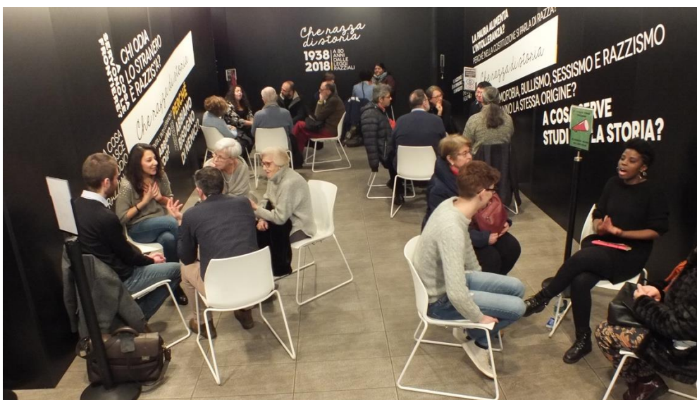
Fig. 2 “ Biblioteca vivente ”. Torino, Polo del '900, Museo diffuso della Resistenza, 2019