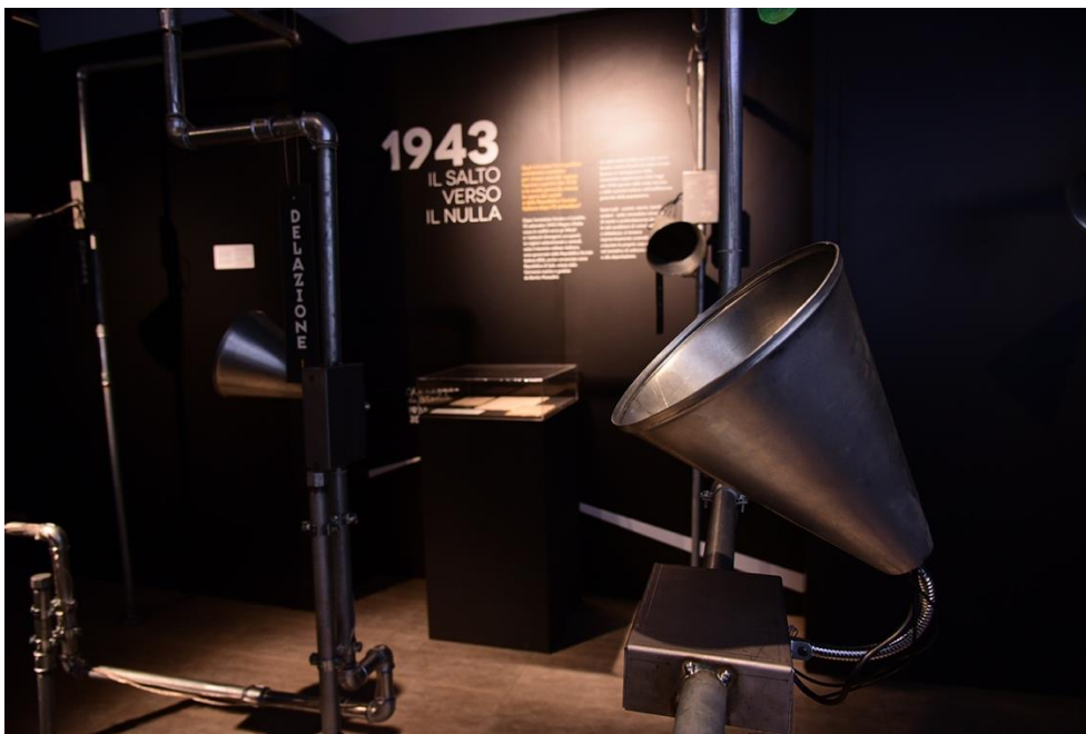
Fig. 1 Installazione “ Che razza di storia ”. Torino, Polo del '900, Museo diffuso della Resistenza, 2018