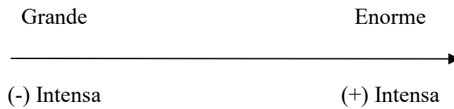
Figura 2- Escala de intensidade Enorme

Afirmamos que temos um caso de Apreciação em relação à Composição porque se trata da avaliação de um ser não consciente, o barulho, em relação a sua complexidade. Podemos perceber que aliado à avaliação do elemento há também uma intensificação dessa avaliação, pois a palavra "enorme" está inserida em um contínuo de intensidade. O minidicionário Aulete (2004) define o verbete enorme como muito grande, muito intenso ou muito grave. Se o autor tivesse escolhido qualquer uma dessas definições do verbete enorme para a escrita do seu texto, ele estaria realizando uma avaliação atitudinal intensificada por um processo de isolamento do subsistema Gradação . No entanto, o autor, objetivando enfatizar o que é dito ou fazer uma economia da língua, optou pela intensificação