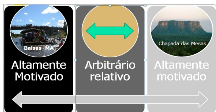
Ilustração 4: Graus de motivação e iconicidade Fonte: A autora

percepções, a captura e controle da realidade e a representam. E a gradatividade pode ser classificada tomando como base os parâmetros básicos pierceanos, ou seja, as inter-relações entre os signos e seus referentes: indicial , que expressa relação material factual, de contiguidade existencial entre o topônimo e seu referente, ocorrendo, nesta classificação, um alto grau de motivação conceptual, cujo mecanismo de escolha se dá de forma metonímica; icônica , em que há similaridades entre o significado transportado pelo topônimo e seu referente, isto é, semelhança entre o significado atual do signo e a forma do referente, ocorrendo também alto grau de motivação - porém menor do que na motivação indicial - cujo mecanismo de escolha se faz de forma metafórica; e simbólica , em que a motivação deixou de ser percebida, e o termo é usado de forma mais desprendida em relação ao icônimo e sem apreensão da inter-relação entre topônimo e referente atualizado.