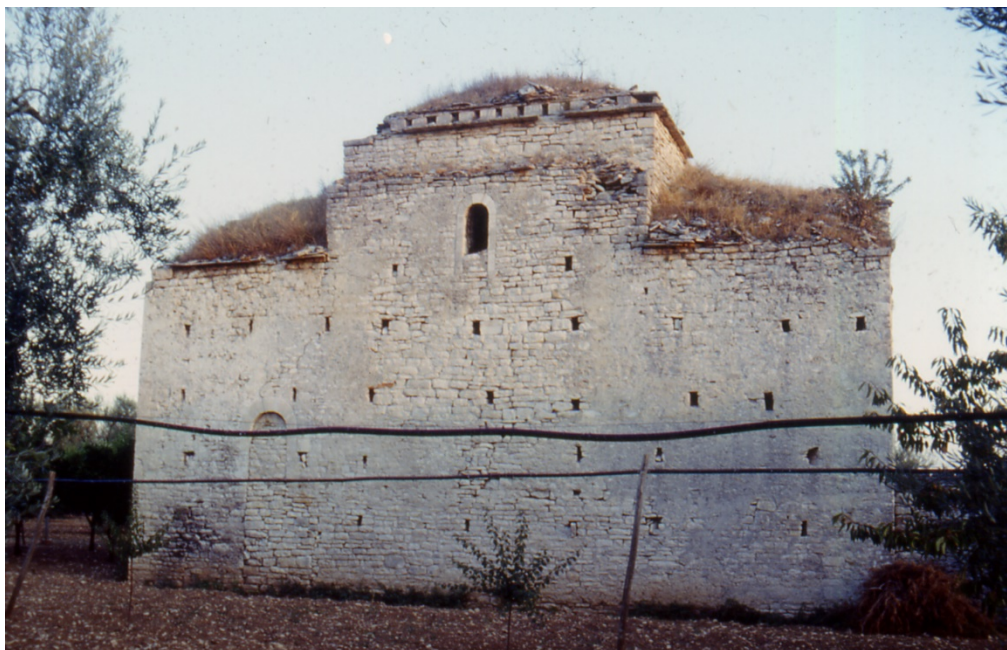
Fig. 2. La chiesa di Ognissanti nel casale di Pacciano (territorio di Bisceglie).