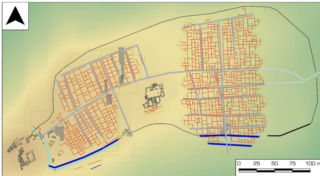
Fig. 3. Esito della prospezione geomagnetica effettuata nel 2020 a Montecorvino, in cui si evidenzia la trama del tessuto abitativo della città. Elaborazione di A. Cardone.

sottostimato per via della evanescenza e della difficile leggibilità delle tracce dell'uso di materiali "leggeri" nelle analisi degli elevati, spesso riconoscibili soltanto attraverso scavi stratigrafici attenti; la tendenziale omologazione in questo caso potrebbe essere dunque soltanto apparente.